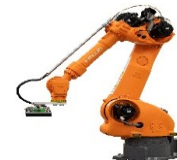
ピッキングロボット