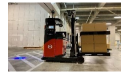
無人フォークリフト