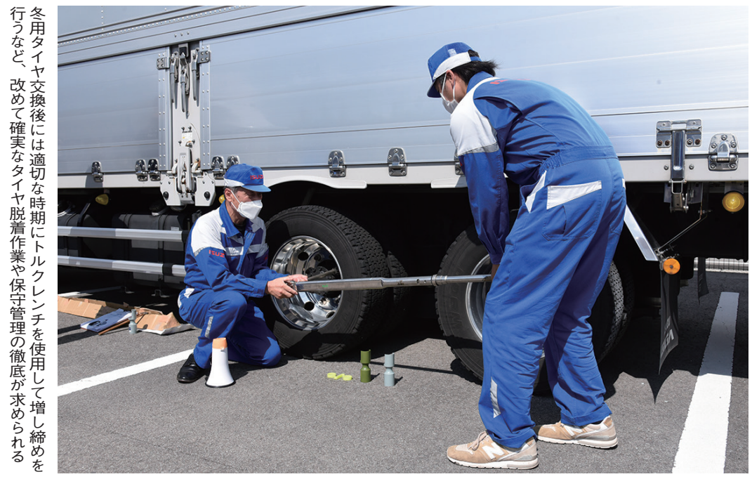
冬用タイヤ交換後は適切な時期にトルクレンチを使用し増し締めを行うなど、改めて確実なタイヤ脱着作業や保守管理の徹底が求められる