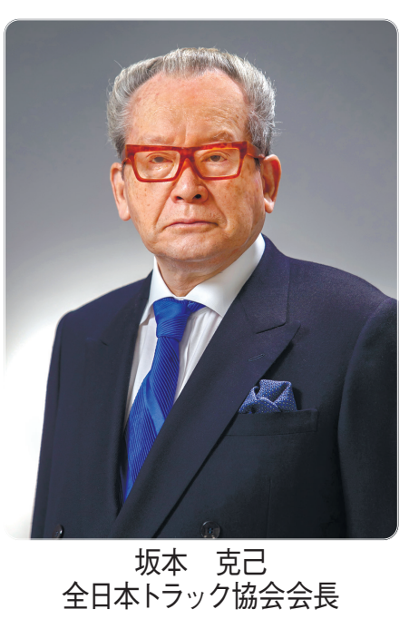
坂本 克己 全日本トラック協会会長