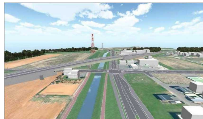
屯田高架橋 完成予想図