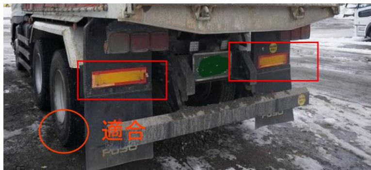
平成 23 年 8 月以前製作車