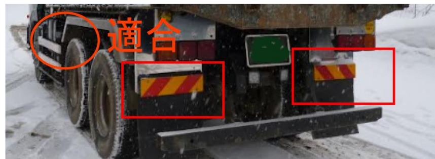
平成 23 年 9 月以降製作車